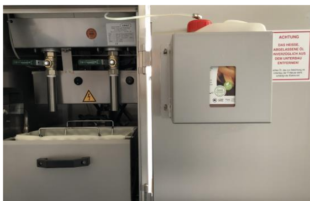
Portabottiglie con finestra di visualizzazione