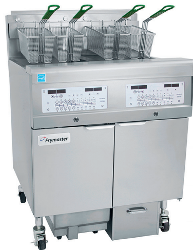
Illustration : Frymaster Filter Quick Station